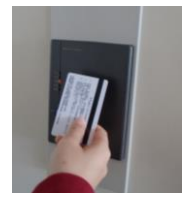
図書館出入口 ICカードリーダー