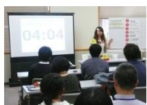
前回のビブリアバトルの様子

「一番読みたくなった本」について投票してもらう観戦者も募集します。観戦者は当日自由参加です。ぜひ、見に来てくださいね!