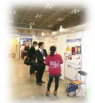
ポスターセッションの様子