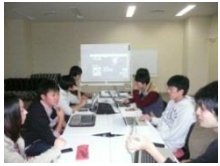
もりけんチームのみなさん。ホワイトボードでもキレイに映し出すことができます。

9月に図書館の一部をリニューアルしましたが、グループ学習室の各部屋もテーブルが可動式になるなど、より便利になりました。