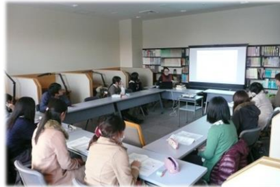
↑ 特別閲覧室でのプレゼンテーションの様子。ライブラリー・アテンダントの講習会です。

図書館で取り組んでいる「ラーニング・commons」。先月号では「多目的スペース」についてご紹介しました。（先月号はHPより閲覧できます。）今月号では「グループ学習・個別学習スペース」についてご紹介します。