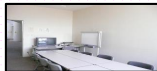
← 左写真は グループ学習室2

図書スタッフのEです。図書館4階のグループ学習室をご存知でしょうか？グループ学習室は、複数人でディスカッションしながら学習できるスペースです。ホワイトボードの利用や、DVDの閲覧もできます。部屋は、10人程度の利用が可能なグループ学習室2と、5～6人で利用できるグループ学習室3があります。利用したい日時にあわせ、部屋を予約することもできますので、ぜひご利用ください！