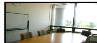
→ 右写真は グループ学習室3