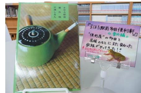
↑ 選書した図書と紹介POP

『まほろ駅前番外地』(三浦しをん 著) 『空飛ぶ広報室』(有川浩 著) 『就職活動をはじめる前に読む本』 (浦上昌則 ほか著) など