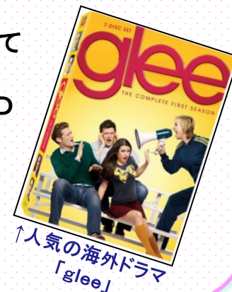
↑人気の海外ドラマ 「glee」

図書館内にDVDが見れる部屋があるってご存じでしたか？ 洋画、韓国映画など、色々な種類のDVDがそろっています。 TOIECの勉強もしっかりできる！ ヘッドフォンで聞きながら勉強できるので集中できること間違いなし！ ぜひお試しあれ♪