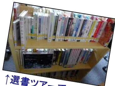
↑選書ツアーで 選んできた本達

先日「選書ツアー」で選んできた本のPOPの作成をしました。 POPの作成は難しかったですが、自分たちで選んだ本の紹介を考えるのはとても楽しい経験でした^^ どれも面白い本ばかりですので、企画展示コーナーへぜひ見に来て下さい！